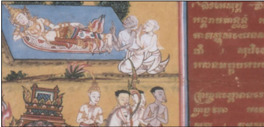
Detail from folding book in Kham script from Thailand