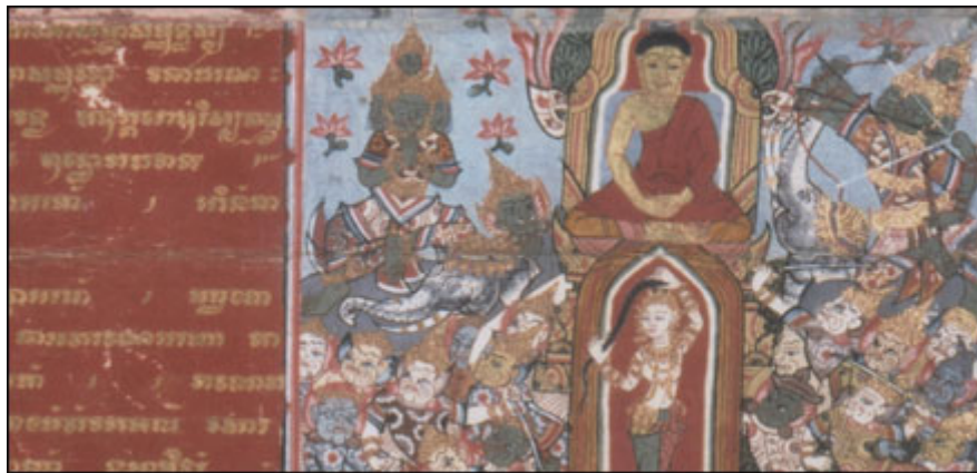
Detail from folding book in Kham script from Thailand