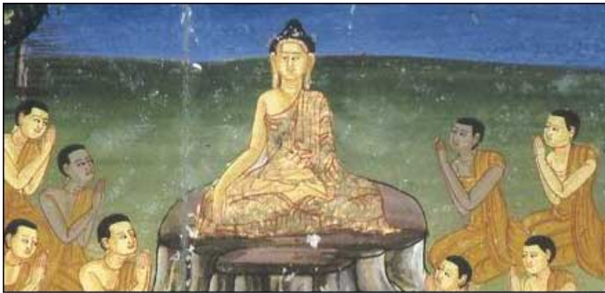
Detail from Burmese eighteenth century folding book